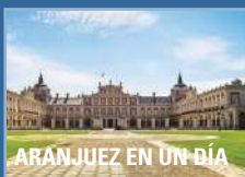
ARANJUEZ EN UN DÍA