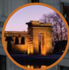
TOUR MADRID NOCTURNO