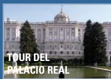
TOUR DEL PALACIO REAL