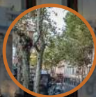
FREE TOUR MADRID PARTE II