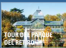
TOUR DEL PARQUE DEL RETIRO