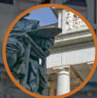
VISITA GUIADA AL MUSEO DEL PRADO